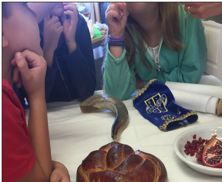
Abb. 1: Betrachtung von Objekten zum jüdischen Neujahrsfest Rosch Haschana, 2. Klasse

Die Deutungen werden von der Lehrperson im Allgemeinen nicht gewertet, sondern lediglich zur Kenntnis genommen. Ausnahmen gibt es, wenn Kommentare abwertend sind. Die Praktik des „in der Schweben halten“ bewirkt, dass verschiedene Facetten eines Themas im Raum stehen und nach einer Erkundung verlangen (Beuke-Galm, 2015).