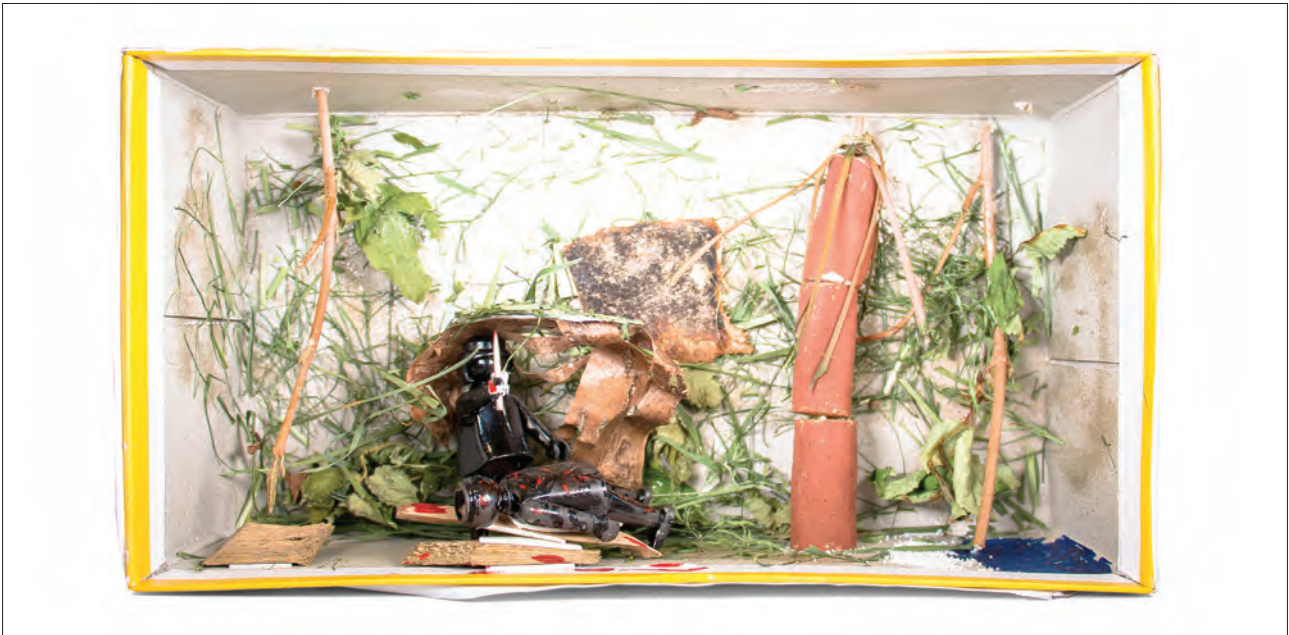
Ritualkiste: Krokodilmänner / Papua Neuguinea