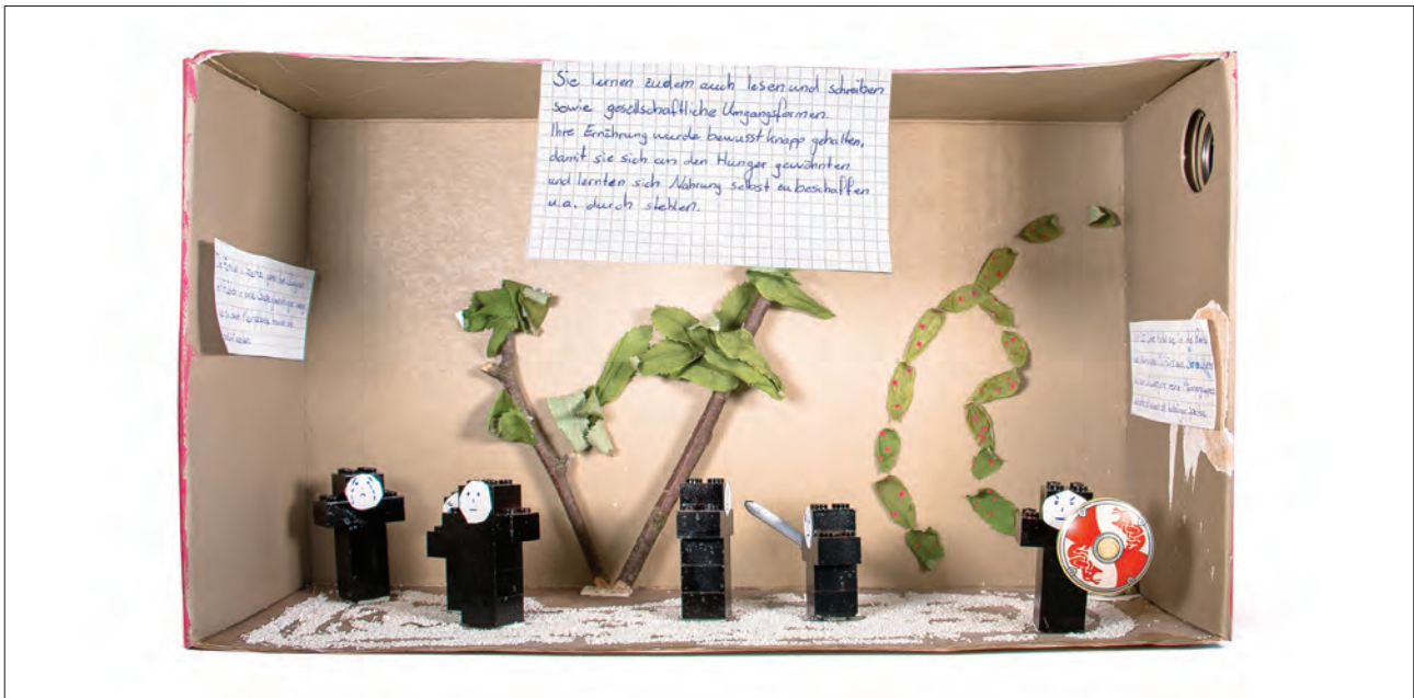
Ritualkiste: Antikes Griechenland / Sparta

(Text linke Wand, Innenseite): Die Familien in Sparta gaben ihre Jungen mit 7 Jahren in eine Gruppe Gleichaltiger weg, wo sie durch Kampfspiele trainiert und abehärtet wurden.