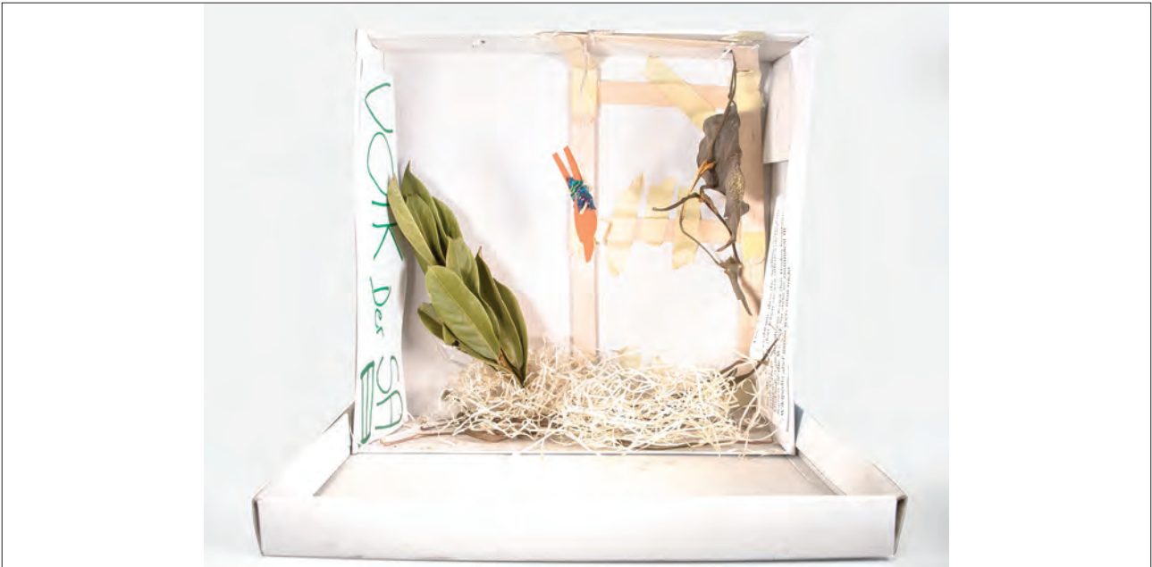
Ritualkiste: Turmspringer / Pentecost